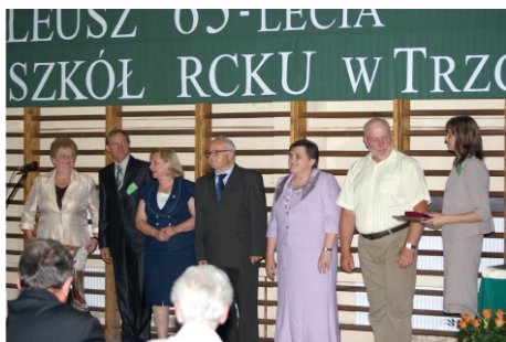
Nagrody i wyróżnienia w czasie 65-lecia Szkoły - 2011 rok

Najprościej zacząć od Jubileuszu 65-lecia szkoły, który miał miejsce 18 czerwca 2011 roku. Wielu z nas, absolwentów i nauczycieli, w nim uczestniczyło, gdyż