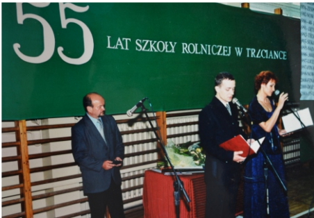
Obchody Jubileuszu Szkoły - 55-lecie