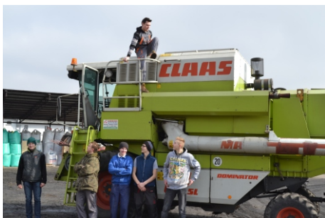
Zajęcia praktyczne w zawodzie technik rolnik

W czasie nauki w Technikum uczniowie odbywają praktyki. W obecnym cyklu kształcenia rozróżniamy dwie jej formy. Po pierwsze: zajęcia praktyczne, które w całości odbywają się na terenie Szkoły (technik rolnik i technik hodowca koni: gospodarstwo szkolne i stajnie, technik architektury krajobrazu: ogród dydaktyczny i szklarnia, technik żywienia: dwie pracownie gastronomiczne, technik weterynarii: pracownie anatomii i inseminacji z wykorzystaniem gospodarstwa). Drugą formą są: praktyki zawodowe, które uczniowie odbywają w trzeciej klasie w różnych firmach i instytucjach specjalistycznych. Wsparciem dla tych praktyk są różnego rodzaju