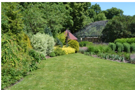
Fragment ogrodu dydaktycznego