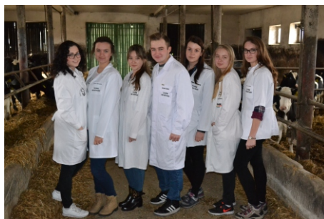
Uczniowie w zawodzie technik weterynarii na zajęciach praktycznych w cieletniku

Głównym kierunkiem produkcji jest bydło mleczne – 125 szt. o wydajności 8000 litrów rocznie. Ogólna liczba bydła