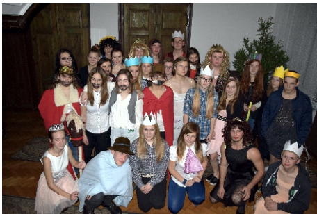
Chrzest pierwszoklasistów mieszkających w internacie - 2015 rok

Wielu absolwentów szkołę w Trzciance kojarzy zwłaszcza z pobytem w internacie. Obecnie funkcjonuje tylko tzw. internat żeński, gdyż nie ma potrzeby uruchamiać