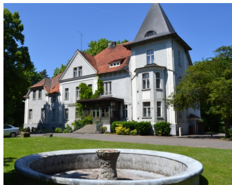
XIX wieczny pałac rodziny Jacobich

Pałac - zbudowany w latach 1870-1880, dwukondygnacyjny z niską wieżyczką, wykazuje cechy modernistyczne, przekształcony i rozbudowany w 1910r., od 1946 do 1982 r. użytkowany jako główny budynek szkolny. Obecnie mieści się w nim kuchnia ze stołówką, aula, sala konferencyjna, pokoje gościnne, izba muzealna oraz pracownia plastyczna.