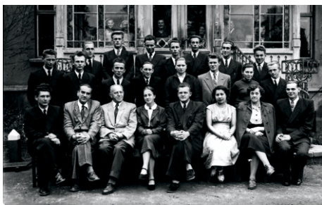
Grono nauczycielskie i uczniowskie - 1956r.