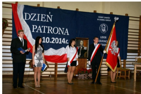
Dzień Patrona - 2014 rok