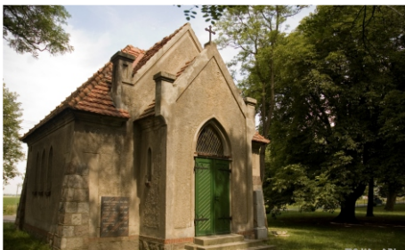
Kaplica - mauzoleum w parku szkolnym.

Główny budynek szkoły z salą gimnastyczną - oddany do użytku w 1982r., znajduje się w nim: 24 gabinetów przedmiotowych i administracyjnych, w tym laboratorium do nauki języków, 2 pracownie technologii żywienia i gastronomii, 3 pracownie komputerowe, centrum multimedialne, mieszczące się w szkolnej bibliotece, hala sportowa z siłownią i zapleczem sanitarnym, sala „Polan” dobudowana w latach 2006-2007 wraz z kompleksem sanitarnym i pomieszczeniami przeznaczonymi na garderobę. W roku 2012 budynek przeszedł gruntowną modernizację termiczną, czyli zyskał nową elewację zewnętrzną i nowoczesny system grzewczy. Poszczególni dyrektorzy nieustannie starali się dostosowywać pomieszczenia do współczesnych form i sposobów kształcenia, dbając również o estetykę zewnętrzną i wewnętrzną całego obiektu. W roku Jubileuszu 70-lecia szkoły został zaprojektowany i wykonany remont korytarza wraz z miejscem reprezentacyjnym.