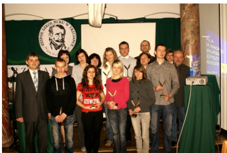
Pierwsza edycja Najlepszego w Zawodzie