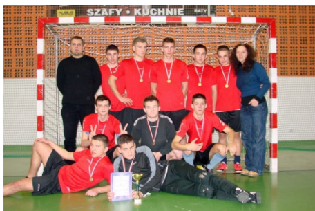
Zawody sportowe w Buku.

W szkole działa prężnie Samorząd Uczniowski. Jest to grupa uczniów - pasjonatów, którzy swój wolny czas poświęcają na działalność związaną z kształtowaniem rozrywkowego wymiaru życia szkolnego. Ich zadaniem jest łączenie głosów uczniowskich z głosami nauczycieli i pani Dyrektor. Choć mają wyznaczone funkcje, to częściej realizują zasadę: jeden za wszystkich – wszyscy za jednego. Do ich obowiązków należy organizowanie takich cyklicznych imprez szkolnych jak: Dzień Edukacji, Andrzejki, Mikołajki, Walentynki, Dzień Wiosny. W ramach swoich obowiązków aktywnie uczestniczą we wszystkich imprezach charytatywnych, a także inicjują nowe wydarzenia w szkole: Dzień Kolorów, Dzień Spódnicy i Krawata czy Dzień Folkloru. To żywiłowa i kreatywna ekipa,