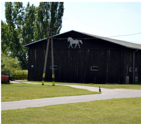
Kryta ujeżdżalnia dla koni wraz z stajnią

Kryta ujeżdżalnia i stajnia - powstała w 2004 r. z dawnej stodoły zbudowanej na początku XX w., w której gromadzono zużyte przedmioty i nieprzydatny sprzęt rolniczy. Po naprawieniu dachu i zniszczonej konstrukcji budynku, we własnym zakresie pracownicy wraz z uczniami szkoły wykonali bandy i ujeżdżalnie oraz wybiegi dla koni. W stajniach znajduje się 15 boksów dla koni. Aktualnie szkoła posiada 10 koni użytkowanych wierzchem.