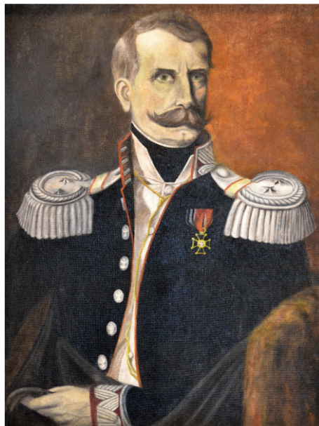
Gen. Dezydery Chłapowski