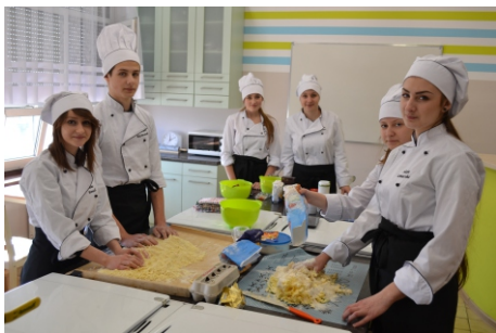
Jedna z dwóch pracowni gastronomicznych.