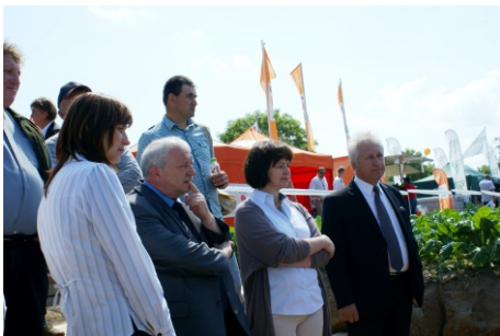
Dzień Buraka - 2014 rok