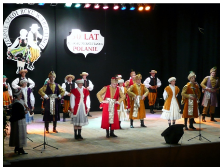
Występ Jubileuszowy 50-lecia Zespołu - 2009 rok

także krajowych i zagranicznych. W swoim repertuarze „Polanie” prezentują polskie tańce narodowe: Polonez, Mazur, Krakowiak, Kujawiak z Oberkiem, a także tańce regionalne, poza Wielkopolską (Szamotyły i od Pięczkowa) tancerze prezentują również folklor krakowski i żywiecki w strojach zgodnych charakterem regionu.