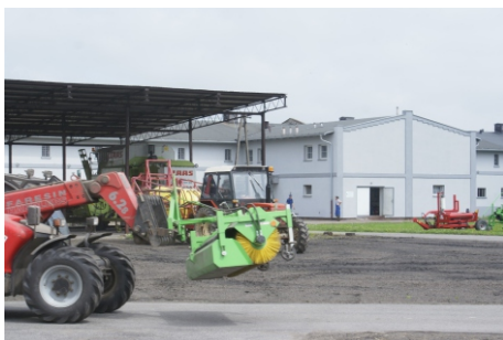
Plac maszynowy gospodarstwa

Obecnie „Polanie” tworzą prawie 50 osobową grupę tancerzy, w tym zarówno uczniów, absolwentów, jak i członków kapeli. „Polanie” są i będą wizytówką trzcianieckiej szkoły i oglądając na ich występ w czasie Jubileuszu 70-lecia szkoły, z optymizmem i radością można patrzeć na ich kolejny dobry etap w historii szkoły.