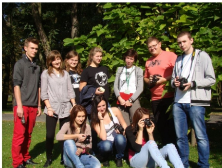
Warsztaty fotograficzne w ramach Tygodnia Zawodu Architektury Krajobrazu - 2014 rok