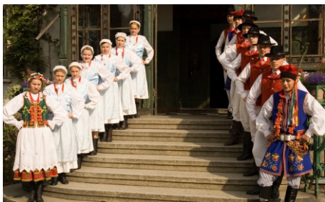
Zespół Pieśni i Tańca „Polanie” - 2006 rok

Grupa działa przy Zespole Szkół już od ponad 57 lat. Od początku swego istnienia dba o kultywowanie tradycji choreograficznych i muzycznych różnych regionów Polski. Jest znakomitym ambasadorem szkoły, lokalnego środowiska, a także kraju. „Polanie” cieszą się niezmienną popularnością, świadczy o tym ilość koncertów prezentowanych podczas imprez lokalnych, regionalnych, a