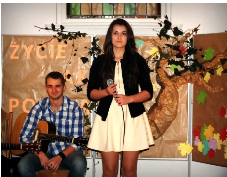
Koncert „Co nam w duszy gra” - 2014 rok