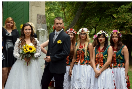
Na planie filmowym teledysku - 2015 rok

Zespół Szkół RCKU w Trzciance nieustannie poszerza swoją ofertę edukacyjną, stając się jedną z najważniejszych szkół średnich naszego terenu. Od roku 2014 rozpoczęliśmy kształcenie w kolejnym prestiżowym zawodzie: technik weterynarii. Co roku w związku z akcją promocyjną podejmujemy wiele inicjatyw zmierzających do zapoznania gimnazjalistów z naszą szkołą. Do tych najważniejszych należą: turnieje sportowe dla gimnazjalistów, organizacja Drzwi Otwartych i warsztatów tematycznych. Od roku 2015 jesteśmy