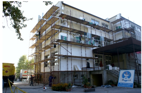
Remont elewacji zewnętrznej głównego budynku szkoły