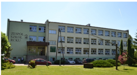
Główny budynek szkoły

Główny budynek szkoły z salą gimnastyczną - oddany do użytku w 1982r., znajduje się w nim: 24 gabinetów przedmiotowych i administracyjnych, w tym laboratorium do nauki języków, 2 pracownie technologii żywienia i gastronomii, 3 pracownie komputerowe, centrum multimedialne, mieszczące się w szkolnej bibliotece, hala sportowa z siłownią i zapleczem sanitarnym, sala „Polan” dobudowana w latach 2006-2007 wraz z kompleksem sanitarnym i pomieszczeniami przeznaczonymi na garderobę. W roku 2012 budynek przeszedł gruntowną modernizację termiczną, czyli zyskał nową elewację zewnętrzną i nowoczesny system grzewczy. Poszczególni dyrektorzy nieustannie starali się dostosowywać pomieszczenia do współczesnych form i sposobów kształcenia, dbając również o estetykę zewnętrzną i wewnętrzną całego obiektu. W roku Jubileuszu 70-lecia szkoły został zaprojektowany i wykonany remont korytarza wraz z miejscem reprezentacyjnym.