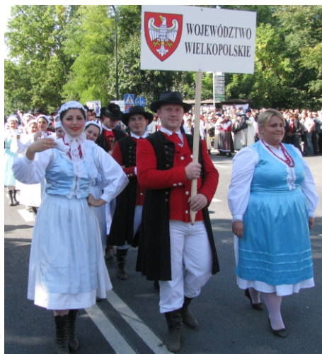
Dożynki Prezydenckie w Spale - 2011 rok

Na początku relacji z lat 2011-2016 wypada przedstawić sytuację Zespołu Pieśni i Tańca „Polanie”. Jest to pewnie, jeden z nielicznych elementów życia szkoły, który wpisuje się w jej historię nieustannie. Dali tego wyraz w dniach 24-25 września 2011r., uczestnicząc w „Dożynkach Prezydenckich” w Spale.