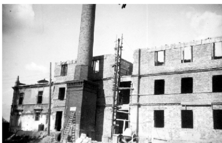
Budowa internatu - 1953r.