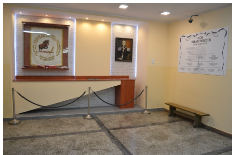
Nowy wygląd korytarza i miejsca reprezentatywnego - 2016 rok